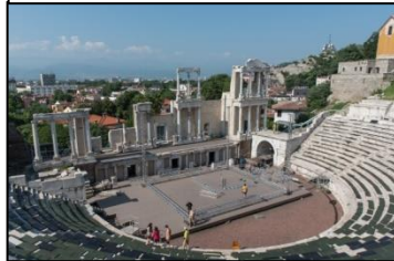
Amphitheater von Plovdiv, c.a. 1. Jhdt. n.Chr.

2.Tag - Montag – Gegen Mittag, Fahrt nach Plovdiv(145km), der europäischen Kulturhauptstadt 2019 und Stadtrundgang durch die Altstadt - ein wunderschönes Ensemble von Häusern aus der Zeit der bulgarischen Wiedergeburt (Mitte des 18. bis Ende des 19. Jh.) erwartet Sie! Ebenfalls werden Sie die Kirche Hl. hl. Konstantin und Elena besuchen, sowie das römische Theater und das römische Stadion.