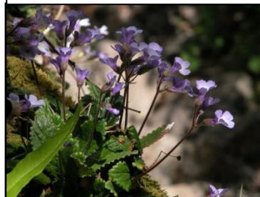
Orpheus-Blume als Symbol der Unsterblichkeit

5.Tag - Donnerstag – Nach dem Frühstück, kurze Fahrt nach Gela - dem angeblichen Geburtsort des legendären Sängers Orpheus! Heutzutage findet hier Anfang August ein Dudelsack-Festival statt, bei dem tausende von Menschen