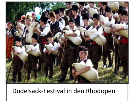
Dudelsack-Festival in den Rhodopen

8.Tag - Sonntag – Nach dem Frühstück, Fahrt nach Sofia und Transfer zum Flughafen.